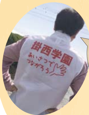
6月6日~29日 樹ニ小家庭科授業