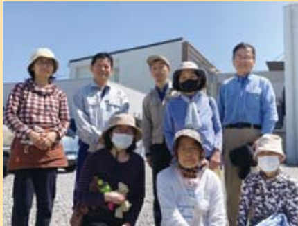
6月5日 中央小学校畑作業