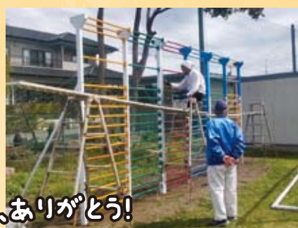
昨年度末 曽我小遊具ペンキ塗り