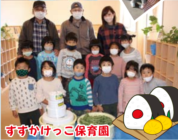
すすかけっこ保育園

今年も地域の方のご協力をいただいて、たくあん作りにチャレンジできました。材料のダイコンも地域の方の畑で作られたものです。